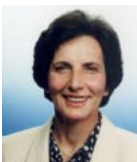
Τσακίρη Εύα Γραμματέας, Δήμαρχος Αβδήρων