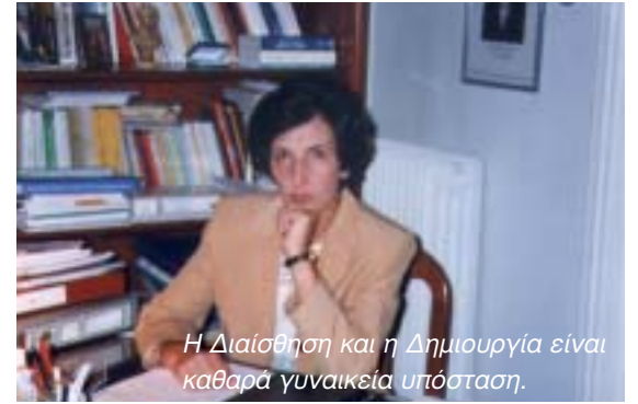
Η Διάισθηση και η Δημιουργία είναι καθαρά γυναικεία υπόσταση.