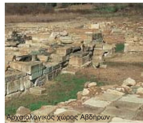
Αρχαιολογικός χώρος Αβδήρων

Και στόχος δεν είναι άλλος από την ανάδειξη της Λίμνης Βιστωνίδας και των Λιμνών Λάφρης - Λαφρούδας σε χώρους περιπατητικού τουρισμού.