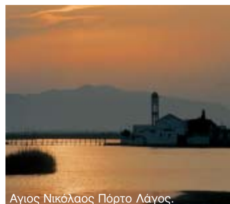
Άγιος Νικόλαος Πόρτο Λάγος.

Σχετική πρόταση έχει καταθέσει ο Δήμος στο Γ' Κοινοτικό Πλαίσιο Στήριξης.