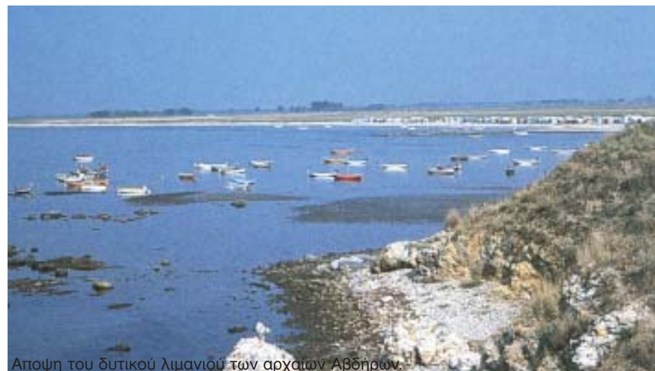
Αποψη του δυτικού λιμανιού των αρχαίων Αβδήρων.

Στο πεδίο του πολιτισμού, ο Δήμος Αβδήρων διαθέτει σήμερα δύο μουσεία, το αρχαιολογικό, που λειτουργεί από τις αρχές του τρέχοντος έτους, και το λαογραφικό, που λειτουργεί στο αναπαλαιωμένο παλιό σχολείο εντός του παραδοσιακού οικισμού των Αβδήρων. Και τα δύο αποτελούν ισχυρούς πόλους έλξης επισκεπτών τους οποίους η Δημοτική Αρχή θέλει να τους ενισχύσει δημιουργώντας ένα πλέγμα ευρύτερης πολιτισμικής αναφοράς ως βάση ικανοποιητική για την ανάπτυξη του αρ-