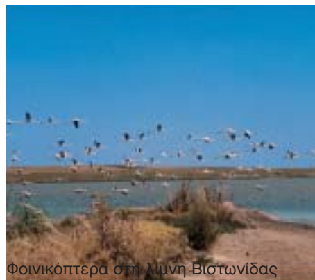
Φοινικόπτερα στη Λίμνη Βιστωνίδας

Επιδιώκει την ανάδειξη των αρχαιολογικών χώρων και συγκεκριμένα, τη συντήρηση των τειχών (Πολύστημα) με έμφαση στον Επισκοπικό Ναό της Βυζαντινής περιόδου της ιστορίας των Αβδήρων, τη συντήρηση του αρχαίου δυτικού λιμένα που υπάρχει