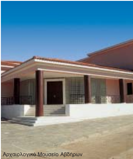
Αρχαιολογικό Μουσείο Αβδήρων