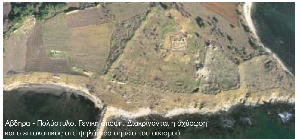
Αβδηρα - Πολύστημα. Γενική άποψη. Διακρίνονται η οχύρωση και ο επισκοπικός στο ψηλότερο σημείο του οικισμού.

λοντος και η αξιοποίησή του ως πλουτοπαραγωγική πηγή αποτελούν τους δύο άξονες της πολιτικής του Δήμου στον τομέα αυτό. Η Δημοτική Αρχή όντας θιασώτης της αειφορικής βιώσιμης ανάπτυξης δίδει ιδιαίτερη βαρύτητα τόσο στο ένα σκέλος όσο και στο άλλο. Πρεσβεύει δε ότι η προστατευτική ομπρέλα της Διεθνούς Συνθήκης Ramsar για τους υδροβιότοπους της περιοχής συμβάλλει αποφασιστικά στη διατήρηση αυτού του φυσικού πλούτου ατόφιου, στοιχείο σημαντικό αν όχι πρωτεύον για την πραγματοποίηση του στόχου.