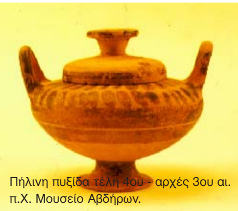
Πήλινη πυξίδα τέλη 4ου - αρχές 3ου αι. π.Χ. Μουσείο Αβδήρων.

Επιδιώκει τη δημιουργία μουσείου Ναυτικής Τέχνης και Παράδοσης