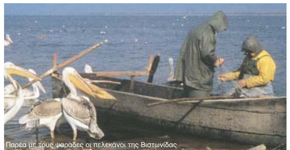
Παρέα με τους ψαράδες οι πελεκάνοι της Βιστωνίδας

Η Δήμαρχος Αβδήρων κ. Ευα Τσακίρη εκτιμά ότι αν η ελληνική πολιτεία αγκαλιάσει το σχεδιασμό του Δήμου που έχει υιοθετηθεί ως ελπίδα προοπτικής από τους κατοίκους, θα κατα-