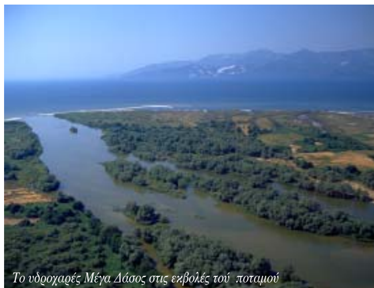
Το υδροχαρές Μέγα Δάσος στις εκβολές τού ποταμού

καλλονής της στο μυαλό μας... Η ανάσα μάς κόβεται βέβαια και την πρώτη φορά που το πανέμορφο φυσικό «κάδρο» τού παραθύρου μας γίνεται ξαφνικά κατάμαυρο. Ως να συνειδητοποιήσουμε ότι περνάμε από γαλαρία έχει επανέλθει μπροστά μας... Και μετά από λίγο, πάλι η απότομη εναλλαγή... Μέχρι να βγούμε από τα Στενά με τις τριάντα γαλαρίες, η διαδικασία έχει μεταβλη-