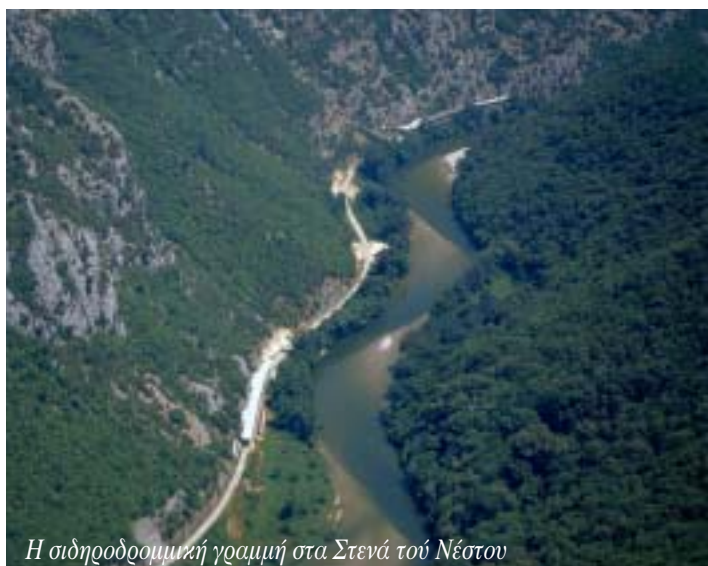
Η σιδηροδρομική γραμμή στα Στενά τού Νέστου

Στο Δασοχώρι τα νερά τα αμιυρά ανακατεύονται με τα γλυκά τού ποταμού. Άλλη η αίσθηση! «Τσιμπήσαμε» και το φρέσκο ψαράκι μας στην παραποτάμια καλύβα τού παπά, πήραμε και τις απαραίτητες «οδηγίες προς ναυτηλωμένους» και ξεκινήσαμε... Εράσμο, Μάγγανα, Μυρωδάτο, Άβδηρα, Αη Γιάννης, Πόρτο Μόλο, Μάνδρα και μετά Λιμνοθάλασσα της Βιστονίδας... Από τη μια απέραντες, θαρρείς, αμμουδιές και από την άλλη γαληνεμένη θάλασσα τού Θρακικού Πελάγους... Βουτήξαμε στα καθάρια νερά της και το φχαριστήθηκαν που μαζέψαμε κοχύλια στο σκάσιμο τού κυματισμού τους. Διαπιστώσαμε με (ευχάριστη ομολογουμένης έκπληξη) πως αυτή η παχιά ψιλή άμμος που απλώνεται ...στρέμματα ολόκληρα να κυλιστούμε πάνω της χωρίς σταματημό, κάπου στο Πόρτο Μόλο δίνει τη θέση της σε βραχάκια που «σκάνε μύτη εδώ» και κεί στην παραλία με ερασιτέχνες ψαράδες πάνωθές τους να «σκοτώνουν» ευχάριστα την ώρα τους... Κάτι που επίσης μάς εξέπληξε ήταν ότι σε καμία απ' όλες αυτές τις παραλίες που περπατήσαμε και κολυμπήσαμε δε βρήκαμε κόσμο να συνοψίζεται ο ένας πάνω στον άλλο (φαινόμενο που, αλλού, σε αναγκάζει να προσέχεις πού ...πατάς και που προκαλεί στα νερά της θάλασσας τη γνωστή θο-