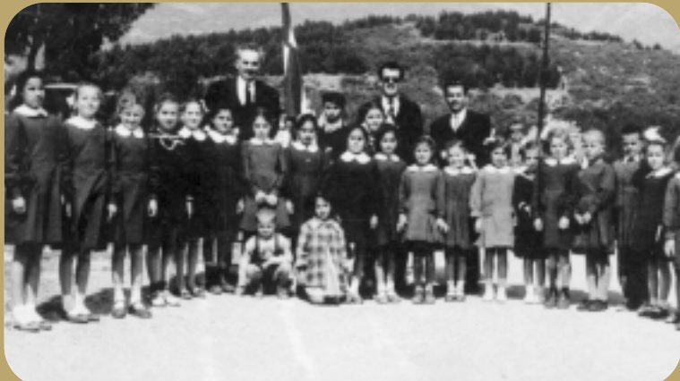
Το Δημοτικό Σχολείο Γαλάνης - Κρωμνικού σε αναμνηστική φωτογραφία του 1957. Μαζί με τα παιδιά, ο Δάσκαλος του σχολείου, ο Πρόεδρος της Κοινότητας και ο Γραμματέας.