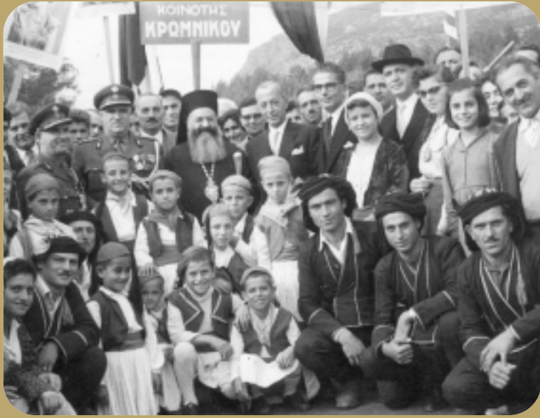
Η νεολαία της Κοινότητας με παραδοσιακές ενδυμασίες κατά την υποδοχή κυβερνητικού εκπροσώπου. Στη δεκαετία του 50, η ελπίδα των κατοίκων για ένα καλύτερο μέλλον ήταν ακόμη ζωντανή...