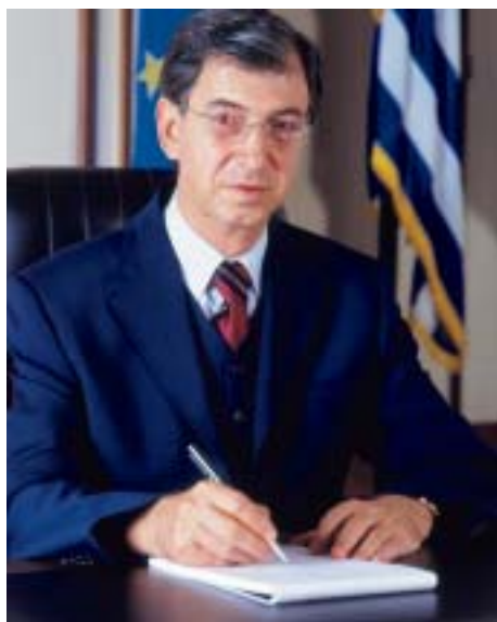
Μιχαήλ Στυλιανίδης, Δήμαρχος Ξάνθης