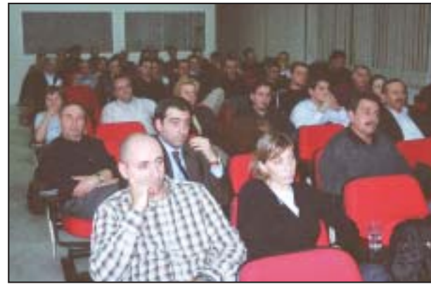
Από την ημερίδα που διοργανώθηκε στο Επιμελητήριο Ξάνθης

Στην αρχή ήταν σαν «πείραμα» και φυσικά το ««ρίσκο» ήταν αρκετά υψηλό. Στόχος: η υποκίνηση του ανθρώπινου δυναμικού που ζει και εργάζεται στην περιφέρειά μας να «ξεδιπλώσει» τις ικανότητες του συμμετέχοντας με πρωτότυπες και καινοτόμες ιδέες οι οποίες θα μπορούσαν να προχωρήσουν-στηριζόμενες από το πρόγραμμα- ως προϊόντα στην αγορά.