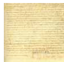
Το «χρυσόβουλλο» του Ι. Ούγκλεση του 1371