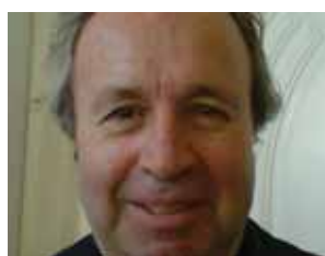
Πέτρου Γεωργαντζή, «Βιστονίδα & Βατοπέδι- Ιστορική διερεύνηση του θέματος» Ξάνθη 2008