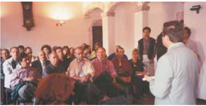
1993 Αποστολή των ΤΕΔΚ Ξάνθης και Δράμας στο Εθνικό Πάρκο του Abruzzo-Ιταλία. Οι αιρετοί και τα στελέχη επιμορφώνονται.

Εν τω μεταξύ το τοπίο στην ορεινή αυτή περιοχή με αργούς αλλά σταθερούς ρυθμούς έχει αλλάξει. Τα έργα που προετοίμασαν οι ΤΕΔΚ με τους Φορείς της περιοχής άρχισαν να υλοποιούνται. Έργα όπως η επέκταση του Δασικού Χωριού στο Λειβαδίτη, οι αναπλάσεις των οικισμών, τα δασικά μονοπάτια, ένα πλήθος ιδιωτικών επενδύσεων αναψυχής και φιλοξενίας τουριστών, το Μουσείο Φυσικής Ιστορίας στο Παρανέστι, η διαφήμιση και αναγνωρισιμότητα της περιοχής, έδωσαν νέα πνοή και ελπίδα για τη συγκράτηση του πληθυσμού στην πε-