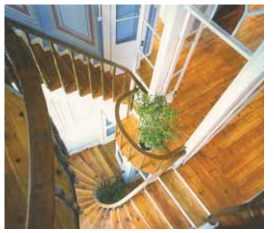
Άποψη από τη σκάλα του κτηρίου. Διακρίνεται αριστερά, μικρό τμήμα από τον εξαιρετικά πλούσιο διάκοσμο του κτηρίου.