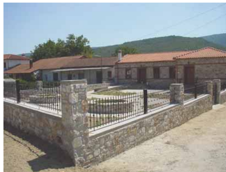
Η οικία Μπαλτατζή μετά την αποκατάσταση