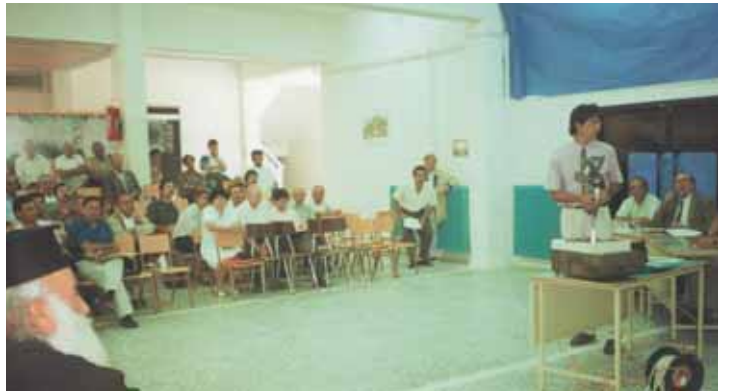
Εκδήλωση που οργάνωσαν οι ΤΕΔΚ σε συνεργασία με την ομάδα έργου εκπόνησης του προγράμματος "Ροδόπη-Νέστος" Προεδρείο ο καθηγητής κος Παύλος Λουκάκης , στο βήμα ο εκπρόσωπος του WWF και σημερινός υπευργός εξωτερικών κος Σπύρος Κουβέλης .

Αναμφισβήτητο η περιοχή μας αποκτά το μεγαλύτερο σε έκταση Χερσαίο Πάρκο της Χώρας, το οποίο μπορεί να μεγαλώσει περισσότερο μέσα από τη δημιουργία του Διασυνοριακού Πάρκου το οποίο εδώ και χρόνια έχει προτείνει η Τοπική Αυτοδιοίκηση.