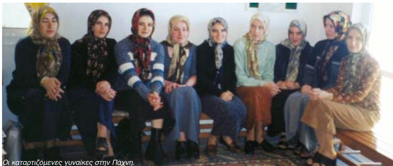
Οι καταρτιζόμενες γυναίκες στην Πάχνη.

Γυναίκες εδώ - οκτώ στον αριθμό επίσης - μέλη της παλιάς