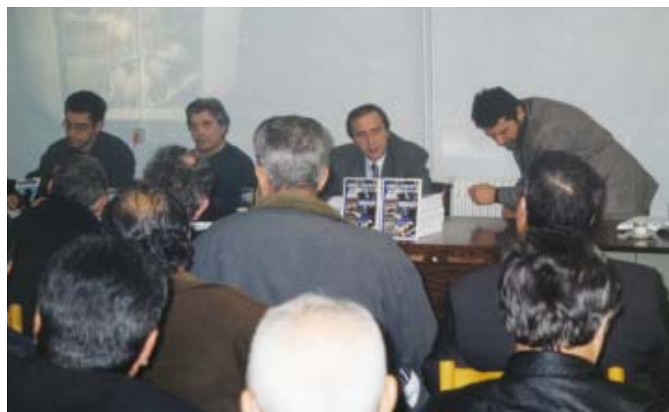
Η Δημοτική Αρχή Τοπείρου έχει ιδιαίτερη ευαισθησία στα θέματα της απασχόλησης των δημοτών της. Για τους αγρότες δημιούργησε έντυπο Οδηγό Αγροτικών Επιδοτήσεων (εδώ, φωτογραφία από την παρουσίασή του) και η Γεωπονική Υπηρεσία ετοιμάζει Γραφείο Αγροτικών Αλλαγών.

Παράλληλα δημιουργεί Γεωπονική υπηρεσία με σκοπό την ενημέρωση και την καθοδήγηση των αγροτών στα νέα δεδομένα και τα συστήματα διαχείρισης & ελέγχου των Κοινοτι-