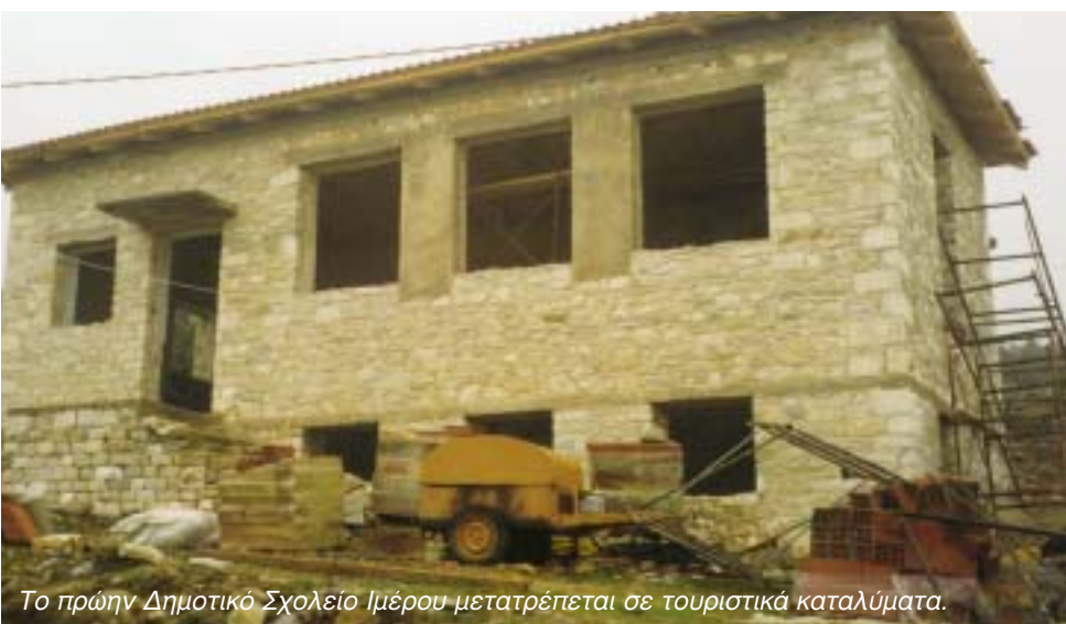
Το πρώην Δημοτικό Σχολείο Ιμέρου μετατρέπεται σε τουριστικά καταλύματα.

Στις παραλίες ή κατασκήνωση (Camping) Μαγγάνων αποτελεί οδηγό της τουριστικής ανάπτυξης όπως την θεωρεί η Δημοτική αρχή, η ίδια θα επεκταθεί και προγραμματίζεται να δημιουργηθούν ανάλογες υποδομές και στην παραλία Ερασμίου.