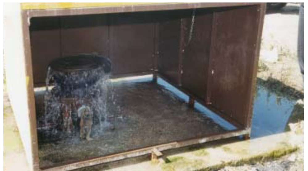
Το γεωθερμικό πεδίο Ερασμίου - Μαγγάνων είναι από τα μεγαλύτερα σε απόδοση ενέργειας στην περιοχή Μακεδονίας - Θράκης. Ο Δήμος Τοπείρου θεωρεί ότι η χρήση του για τις καλλιέργειες θα δώσει νέα διάσταση στον κατ' εξοχήν αγροτικό Δήμο του νομού. Στη φωτογραφία προετοιμασία υποδομών για την αξιοποίηση.

την θέληση για συνεργασία των αγροτών μπορούν να έρθουν τεράστιες αλλαγές με την αξιοποίηση στη γεωργία στις διάφορες καλλιέργειες (γεωργικές και αλιευτικές).