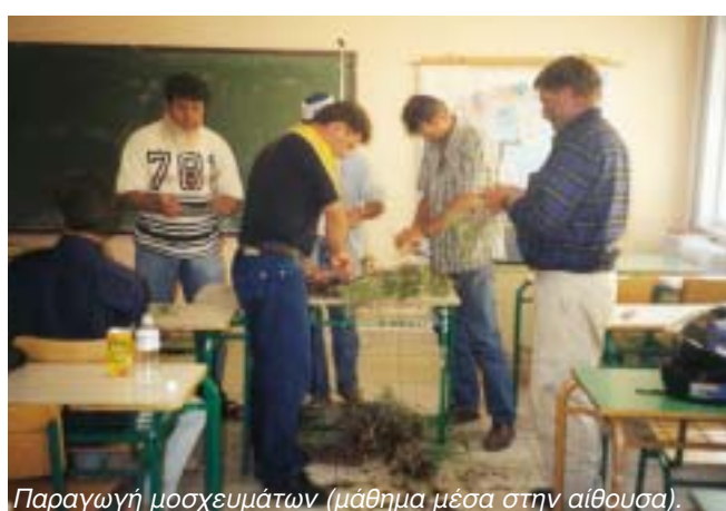
Παραγωγή μοσχευμάτων (μάθημα μέσα στην αίθουσα).