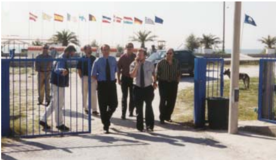
Η τουριστική πολιτική είναι πρώτη επιλογή του Δήμου Τοπείρου. Στη φωτογραφία με τον Γ.Γ. Περιφέρειας Α.Μ.Θ., κ. Σταύρο Καμπέλη, στην κατασκήνωση (camping) Μαγγάνων που συνεχώς βελτιώνεται.

Παράλληλα βρίσκεται στην προετοιμασία και διερεύνηση ανάπτυξης και αξιοποίησης εγκαταλελειμμένων κτιρίων όπου προβλέπονται να δημιουργηθούν υποδομές οικότουριστικές.