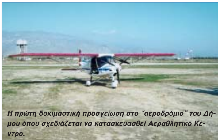
Η πρώτη δοκιμαστική προσγείωση στο «αεροδρόμιο» του Δήμου όπου σχεδιάζεται να κατασκευασθεί Αεραθλητικό Κέντρο.

ναι γιορτές που συγκεντρώνουν πλέον μεγάλο αριθμό επισκεπτών μέσα κι έξω από το Νομό τονώνοντας την πολιτιστική ζωή τού τόπου: Καθαρά Δευτέρα στον Πολύσιτο (παρέλαση αρμάτων με λαογραφικά και σατυρικά θέματα, παραδοσιακή μουσική και νησίσσιμα εδέσματα), Πατατιάδα στη