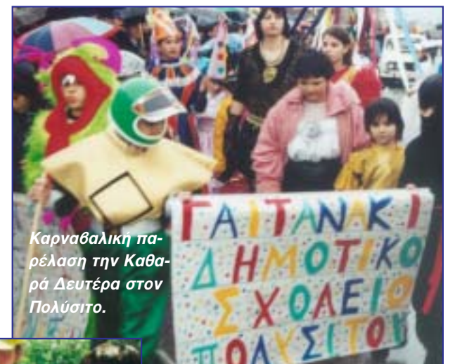
Καρναβαλική παρέλαση την Καθάρά Δευτέρα στον Πολύσιτο.

κής δραστηριότητας για την αύξηση των θέσεων εργασίας. Γι' αυτούς τους σκοπούς ο Δήμος έχει αναλάβει μια σειρά δράσεων οι βασικότερες των οποίων είναι η δημιουργία Αγροτικής Επιχείρησης Ανάπτυξης (που ασχολείται με τη διαχείριση των αρδευτικών υδάτων στην περιφέρεια του δήμου και με δραστηριότητες που προάγουν την αγροτική ανάπτυξη) και Γεωπονικής Υπηρεσίας (που έρχεται να καλύψει με τη συνδρομή της το μεγάλο κενό πληροφόρησης που υπάρχει στον αγροτικό κόσμο και το οποίο ευθύνεται ως επί το