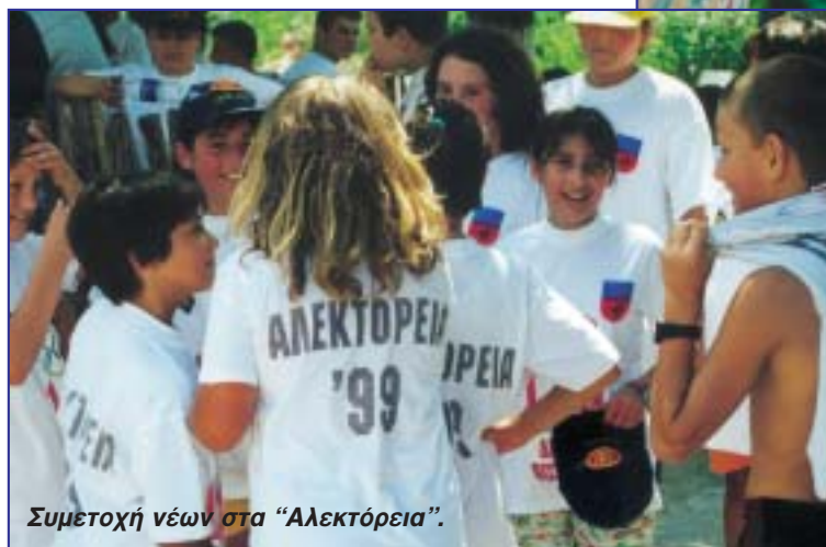
Συμετοχή νέων στα "Αλεκτόρεια".

πλείστον για τη στασιμότητα ή και την υποβάθμιση του αγροτικού τομέα στην περιοχή). Ο απολογισμός της λειτουργίας των δομών αυτών είναι ήδη θετικός προς την κατεύθυνση της ανάπτυξης της υπαίθρου. Παράλληλα, η Δημοτική Αρχή έχει προωθήσει την δημιουργία Κέντρου Επιχειρηματικότητας στη Συδινή, ένα σημαντικό εργαλείο για την ανάπτυξη επενδυτικής δραστηριότητας στον δευτερογενή και τρι-