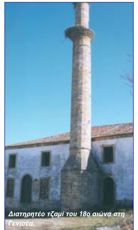
Διατηρητέο τζαμί του 18ο αιώνα στη Γενισέα.

Ο άξονας «οικονομική ανάπτυξη» έχει δύο κύρια σκέλη: την στήριξη και εκσυγχρονισμό της αγροτικής παραγωγής και την προσέλκυση επιχειρηματι-