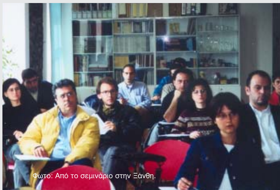
Φωτο: Από το σεμινάριο στην Ξάνθη.

Μια έννοια που σύντομα θα μπει στην καθημερινή μας ζωή - Προτεραιότητα στα Δημόσια Κτίρια.