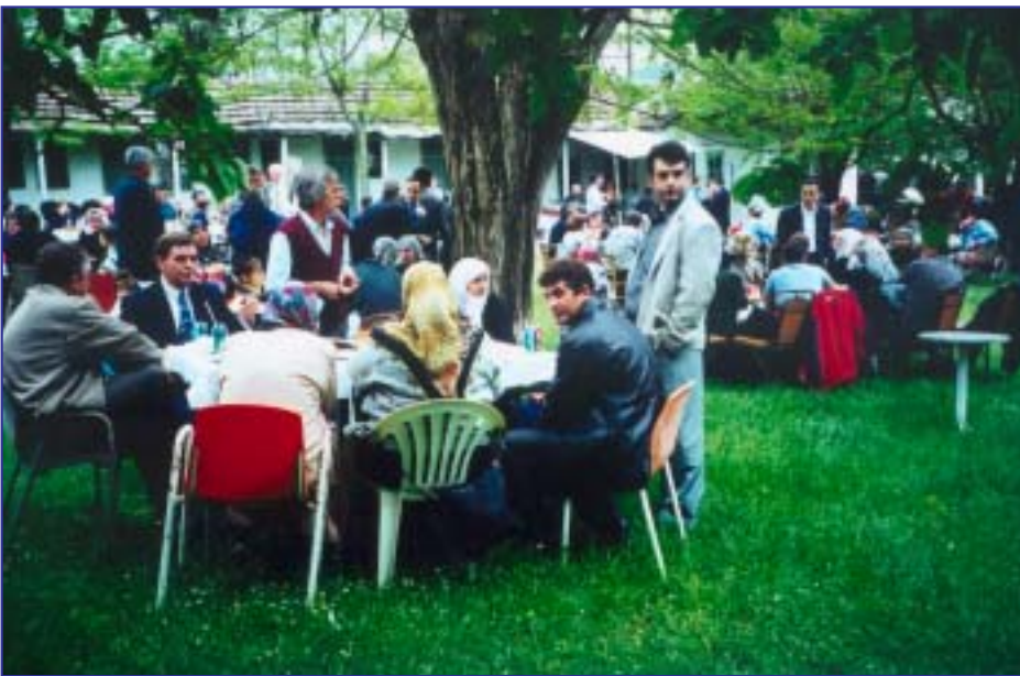
Για τη Γιορτή της Άνοιξης, είναι εκατοντάδες ίσως και χιλιάδες αυτοί που ‘ανεβαίνουν’ στις Θέρμες. Συνορεύουν από όλες τις μεριές της Θράκης, ήδη από την παραμονή του Hidirlez... Μια ‘δεύτερη’ πρωτομαγιά με καθαρά λατρευτικό χαρακτήρα για τη φύση, που όπως είναι φυσικό δεν αφήνει ασυγκίνητο κανένα.