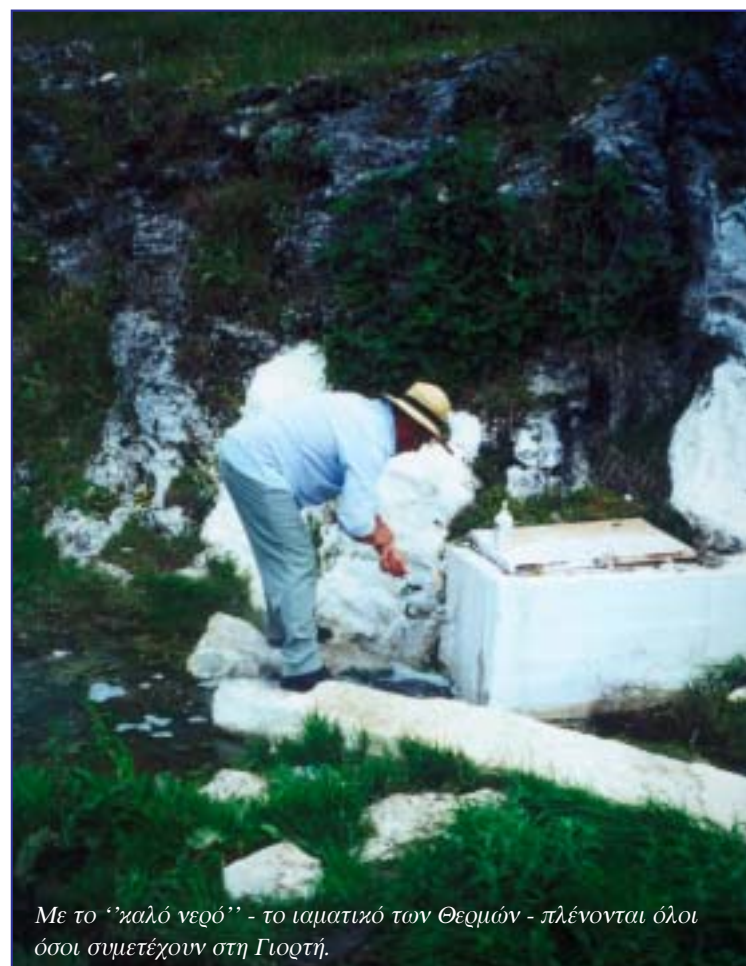
Με το "καλό νερό" - το ιαματικό των Θερμών - πλένονται όλοι όσοι συμμετέχουν στη Γιορτή.