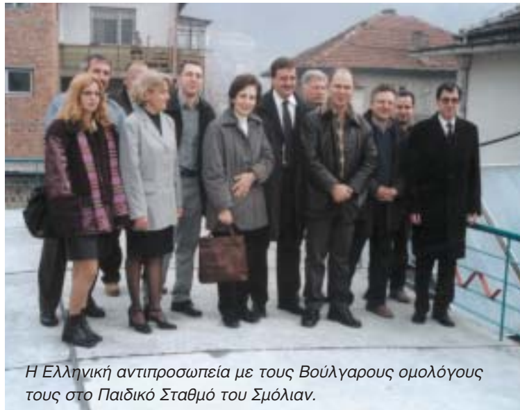
Η Ελληνική αντιπροσωπεία με τους Βούλγαρους ομολόγους τους στο Παιδικό Σταθμό του Σμόλιαν.

Τα μέλη της ελληνικής αποστολής παρέστησαν στα εγκαίνια των εγκαταστάσεων του συστήματος παροχής ζεστού νερού για χρήση και θέρμανση από ηλιακή ενέργεια στον παιδικό σταθμό του Σμόλιαν