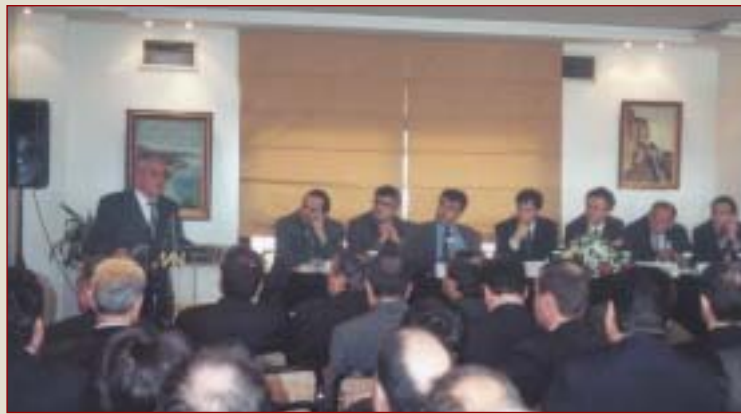
Από το πρόσφατο Συνέδριο της ΤΕΔΚ Ν. Ξάνθης

Υπ' αυτό το πρίσμα, η εργώδης προσπάθεια που καταβάλλεται σε όλα τα επίπεδα και οι πρωτοβουλίες που αναλαμβάνονται για την υποστήριξη των ΟΤΑ της Ξάνθης, για την προώθηση των