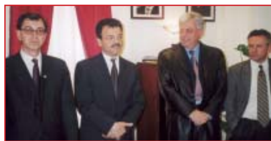
Ο Πρόεδρος της ΤΕΔΚ, ο αντιδήμαρχος Σταυρούπολης, ο πρόεδρος του Δήμου Ασένοβραντ και ο αντιπρόεδρος της ΤΕΔΚ στο Δημαρχείο Σταυρούπολης.

από το Πρόγραμμα «Ελληνικό Σχέδιο οικονομικής ανασυγκρότησης των Βαλκανίων»