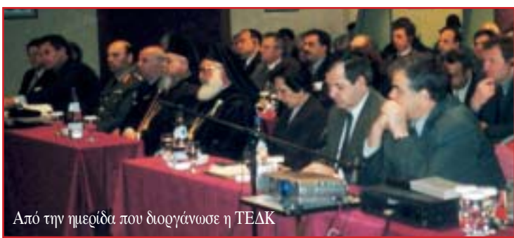
Από την ημερίδα που διοργάνωσε η ΤΕΔΚ

Μετά την ανακοίνωση της αμοδίας Γενικής Διεύθυνσης για την έγκριση του Κοινοτικού Προγράμματος που υπέβαλε η ΤΕΔΚ Ν. Ξάνθης με τίτλο «Οι δυνατότητες αειφορικών πόλεων και Δήμων», αντιπροσωπεία 25 Δημάρχων και στελεχών της Ένωσης ΟΤΑ-Ροδόπης Βουλγαρίας επισκέφθηκε το Νομό Ξάνθης προσκεκλημένοι της ΤΕΔΚ 29, 30, 31 Μαρτίου.