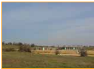
Αρχική φάση κατασκευής