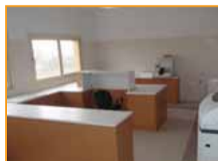
Το Μικροβιολογικό Τμήμα