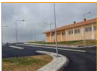
Οι θέσεις πάρκινγκ