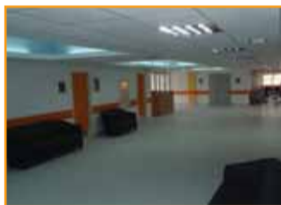
Η αίθουσα αναμονής