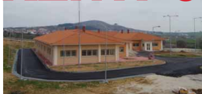
Άποψη του Κέντρου Υγείας με τον οικισμό Αβδήρων πίσω του