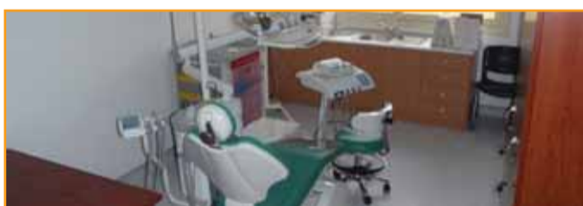
Το Οδοντιατρικό Τμήμα