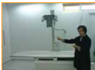
Το Ακτινολογικό Τμήμα