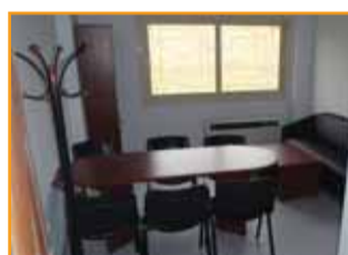
Γραφείο συνεργασίας προσωπικού