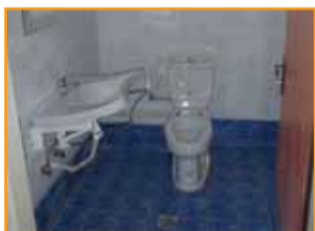
Τουαλέτες για άτομα με ειδικές ανάγκες